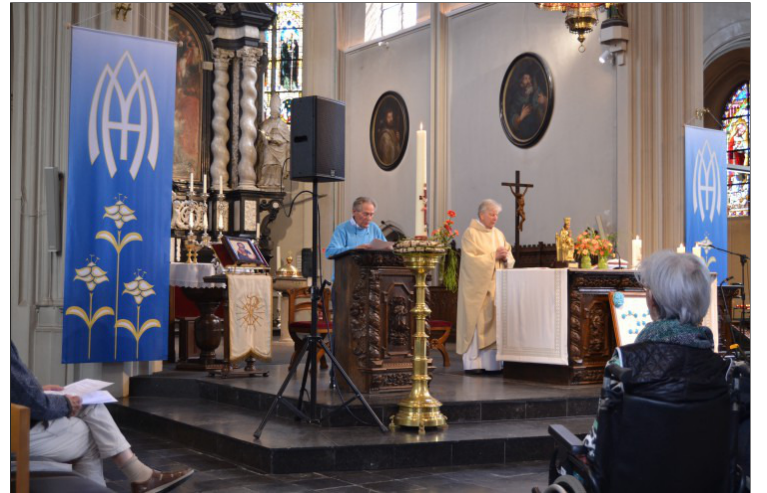
Bidden rond Maria

4. Wij bidden tot de Heilige Maria, omdat wij bij haar de echte troost vinden . Wanneer wij een groot verlies meemaken door het overlijden van een geliefde of door een zware tegenslag, dan voelen wij een sterk gemis. Dat gemis geeft een leegte die soms niet te dragen of te verdragen is. Die leegte kan als heel zwaar aanvoelen. Troost is dan de aangename gewaarwording die in die leegte komt wonen en ons een beter gevoel geeft. We weten dat mensen troost zoeken in het kopen en in het consumeren. Maar die troost verwelkt na enige tijd, ze