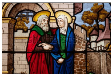
Anna en Joachim ontmoeten elkaar bij de Gouden Poort van Jeruzalem. Glas in lood, 19de eeuw, Troyes, Frankrijk

Van de Heilige Maria hebben we ook een fotoalbum. Fictief dan wel. Het zijn geen foto's gemaakt met een fototoestel, maar door onszelf gecreëerd bij het luisteren naar de verhalen die gaan over de Heilige Maria. Ons visueel voorstellingsvermogen werkt zo goed dat het leidt tot verrassende beelden. Daarbij kennen we ook de vele schilderijen en beeldhouwwerken die onze geest voeden. En zo stellen we vandaag de foto samen over de ouders van de Heilige Maria: de Heilige Anna en de Heilige Joachim . Op de foto die we zelf maken zien we hen beiden bij de Gouden Poort van Jeruzalem. We zien ook een engel.