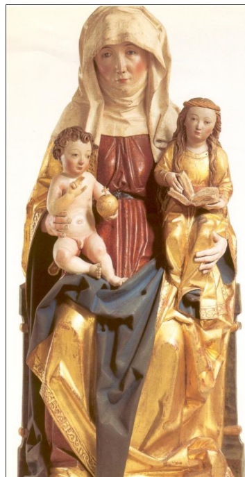
Sint-Anna-te-Drieën ca. 1500, Houtsculptuur, Duitsland, Rottweil, Dominikanermuseum