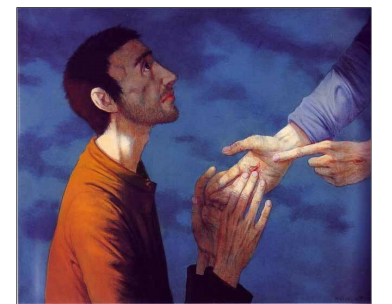
© Michel Ciry – Incrédulité de Thomas

Vrede zij met u! Steek je handen uit, en leg ze in de wonden van de lijdende medemens. Want dat zijn vandaag de wonden van de Christus. Alleen door je te laten raken kan je tot geloof komen. Zo sprak de Verrezenen, en zo spreekt Hij nog altijd. Vrede zij met u!