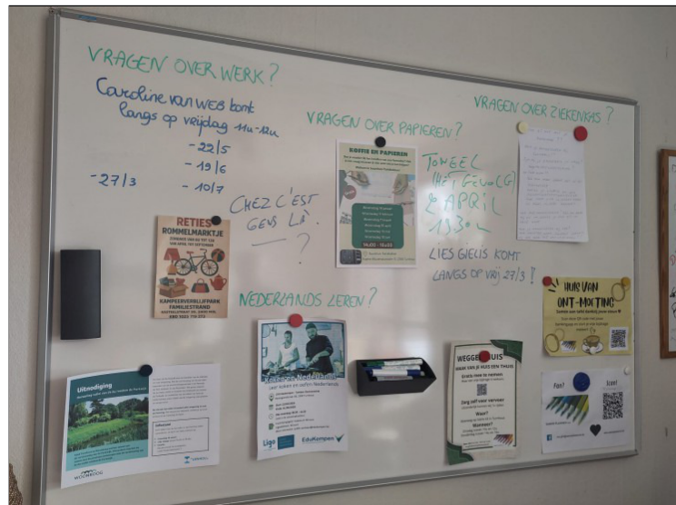
Het Huis van Ont-Moeting

De meeste spullen die we inzamelen in de kisten komen terecht in het Weggeefhuis. Op de Steenweg op Gierle 63 in Turnhout – een leegstaand pand dat SAMEN PLANNEN tijdelijk gebruikt – kan iedereen die dat wenst gratis spullen komen halen. Er is geen doorverwijzing nodig, geen registratie van gegevens, de hele werking is zo laagdrempelig mogelijk. Het Weggeefhuis is bewust niet ingericht als een winkel, maar zo veel mogelijk als een huis. Er is een woonkamer, waar alle woondecoratie staat, een keuken met servies en keukengerei, een koer met bloempotten en buitenspeelgoed. Op de eerste verdieping is er een kamer met dameskleding, en een kamer met kinderkle-