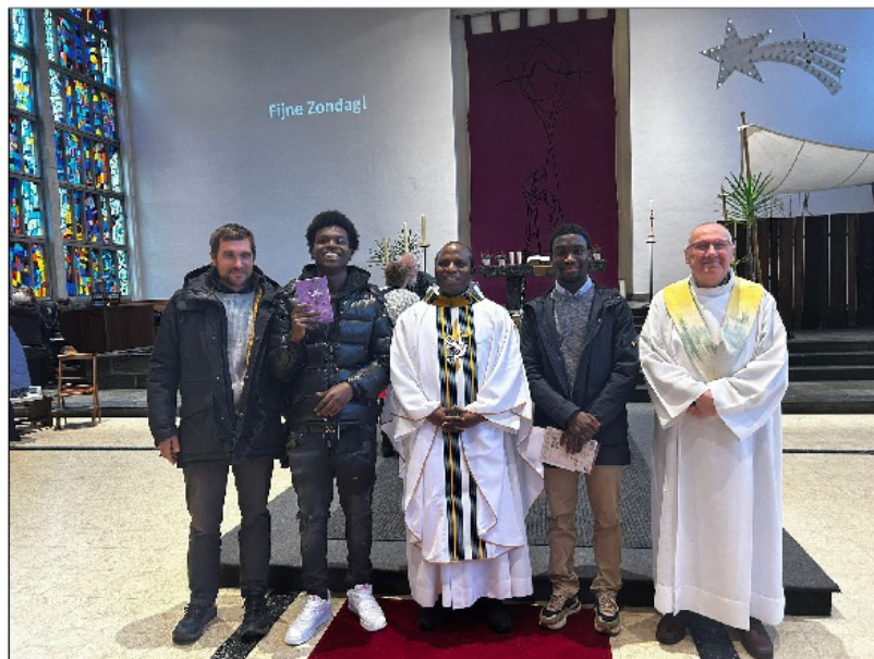
Drie stralende vormselkandidaten na hun naamopgave

het woord een wonder, of zoals de evangelist Johannes zegt "een teken" dat God ons zendt. Geen continent is sterker getroffen dan Afrika door talloze rampen en vaak gruwelijk lijden, en er zijn geen volkeren die sterker dan de Afrikanen de kracht uitstralen van hoop en blijmoedigheid. En telkens weer zien we hoe die levenskracht wortelt in een diep en intus gdoof. Voor onze oude en vaak vermoeide Europese Kerk, en voor heel onze samenleving, is de aanwezigheid van onze Afrikaanse medechristenen een bron van hoop en kracht, een echt Gods-geschenk. Laten we dit geschenk dankbaar ontvangen en omarmen. Dirk Godexcharle