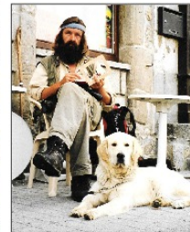
De foto's zijn gemaakt door pelgrims onderweg.