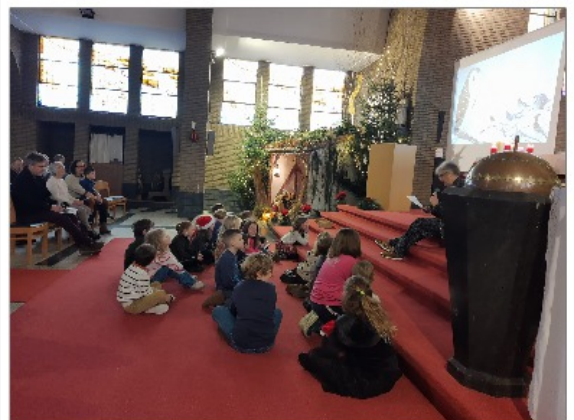
Aandachtige eerste communicanten

Enkele dagen later begeleidden enkele enthousiaste ouders deze kinderen in een ontdekkingstocht door het kerstgebeten en door de kerk, afgesloten door een creatieve