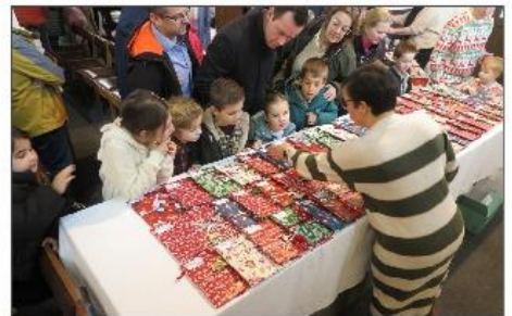
Voorelke eerste communicant een cadeau