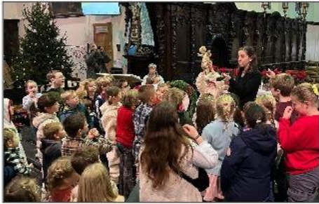
Een geschenk uit de hemel..