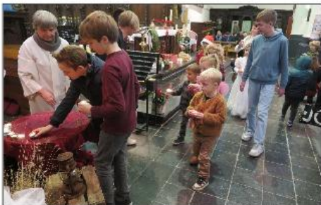
Een stoet van warmte en licht.