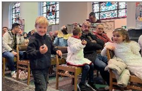
Een lichtje, een schaap en een engel met het communicatiekleed van mama