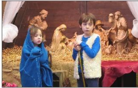
voor Maria en Jozef bij de stal.